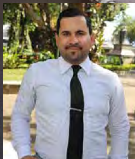
Colaboración de Guillermo Gómez Zúñiga. Departamento Gestión Empresarial I en Salud Ocupacional

En el Departamento de Gestión Empresarial en Salud Ocupacional del Instituto Nacional de Seguros (INS), tenemos muy clara esa responsabilidad, por eso realizamos muchos esfuerzos no solo para concientizar a los empresarios y trabajadores respecto a esta problemática, sino también a través del diseño,